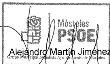
Portavoz Grupo Socialista